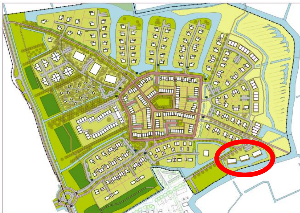
plankaart buurtschap De Hem

Aan de zuidzijde van De Hem zijn 3 appartementengebouwen beoogd. In de welstandsrichtlijnen staat dat het gaat om 2 of 3 volumes met minimaal 2 richtingen/orientaties. In verband met de privacy ten opzichte van de woningen in De Klamp verzoekt indiener de orientatie en het aantal aan te passen, zodat er meer privacy voor de bewoners van De Klamp ontstaat. Daarnaast geeft indiener aan dat het aantal van drie van deze gebouwen niet past in het idee van dorpen waarop de buurtschappen gebaseerd zijn, dat is te veel. Drie van dergelijke gebouwen zouden beter in Middelsee passen.