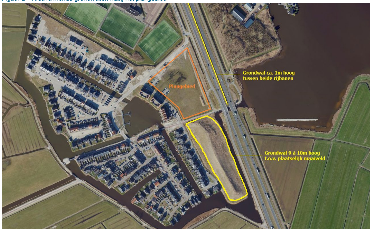
Figuur 2 – Afscherpende grondwallen nabij het plangebied

Aanvullend op de bestaande grondwallen is de gemeente Leeuwarden voornemens een nieuwe grondwal te realiseren tussen het plangebied en de Drachtsterweg. Deze grondwal is nog niet in detail uitgewerkt. Voor dit akoestisch onderzoek is uitgegaan van een hoogte van 10 meter ten opzichte van NAP, wat vergelijkbaar is met de bestaande grondwal ten zuiden van het plangebied.