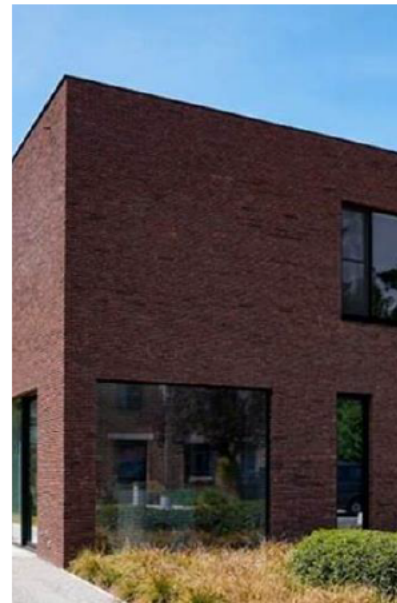
Afwisseling in gevelopeningen