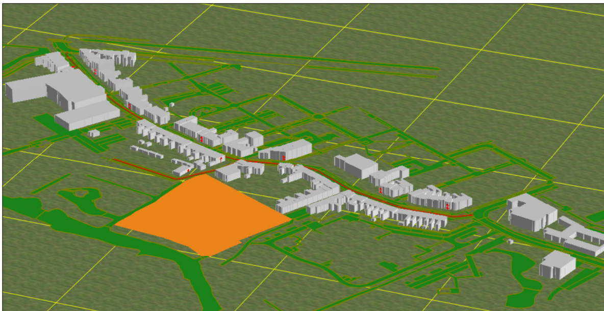
Afbeelding 2: 3D-weergave rekenmodel (gezien vanuit zuidoostelijke richting)

Een overzicht van de invoergegevens (bebouwing, geluidreflecterende bodemgebieden en wegen) is gegeven in bijlage 2. Voor het niet-gedefinieerde bodemgebied is een bodemfactor B = 0,5 aangehouden (deels reflecterend, deels geluidabsorberend). Een driedimensionale weergave van het rekenmodel is geven in afbeelding 2.