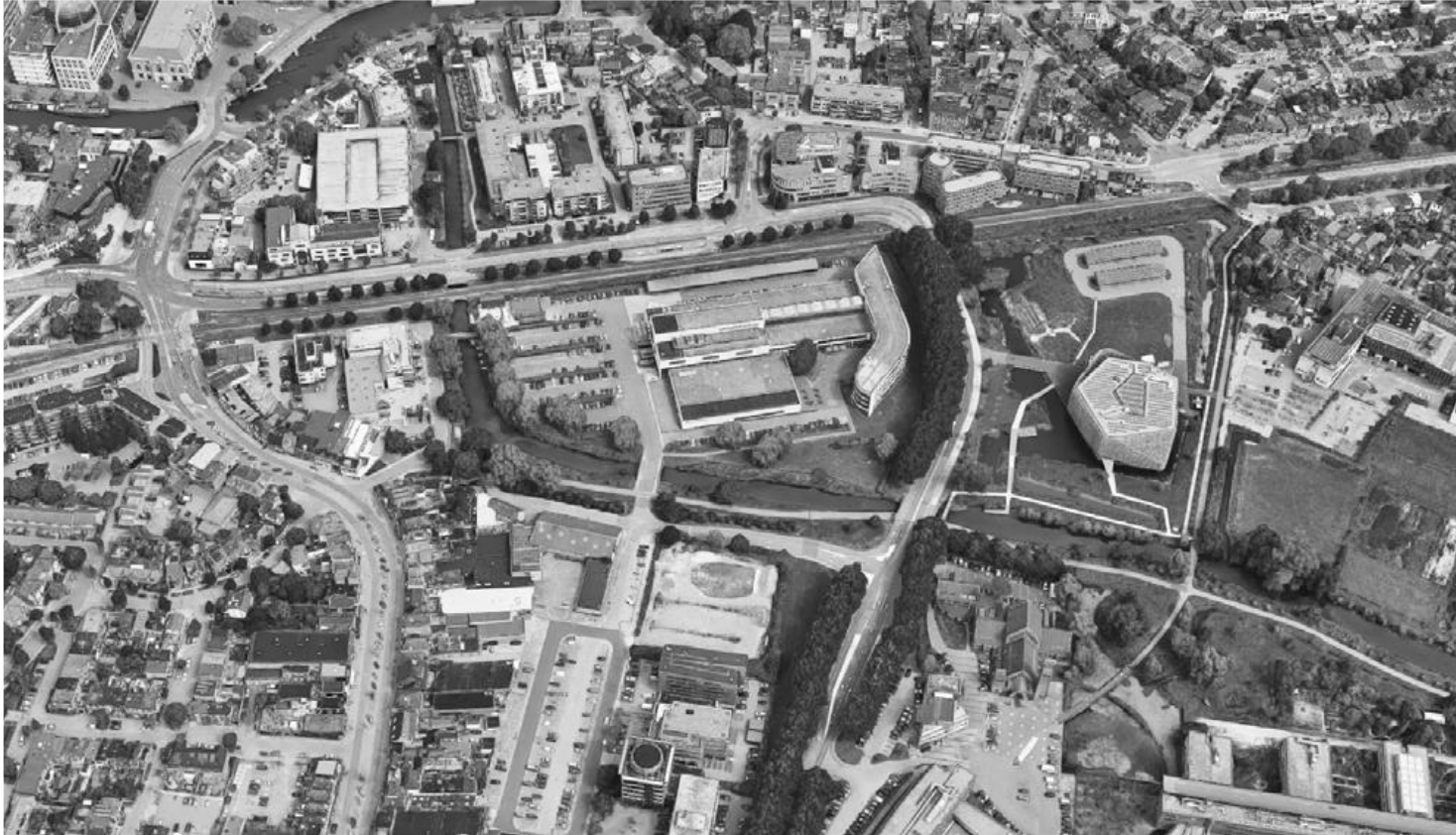
Luchtfoto huidige situatie