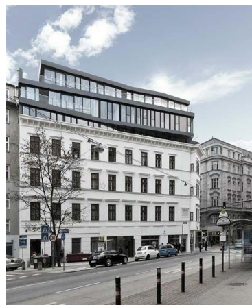
Optopping van de bestaande kantoorboog als eerste stap in de ontwikkeling van de campus.