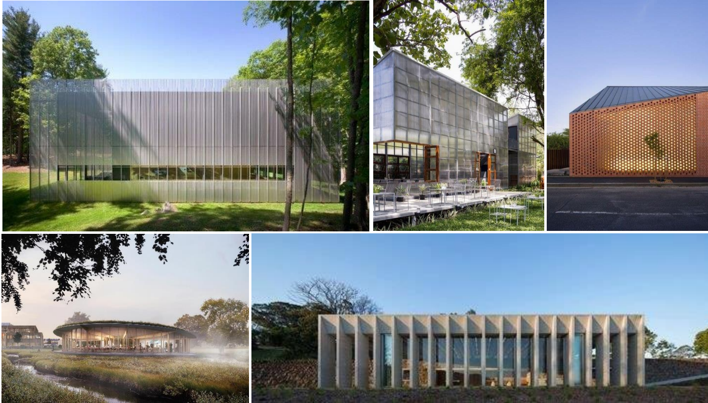
Kleinschalig paviljoen, zorgvuldig ingepast in het landschap