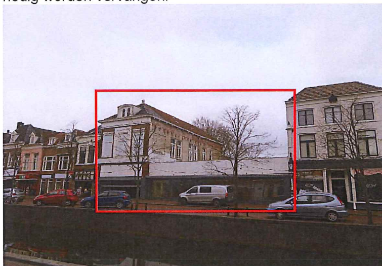
Figuur 1. Planlocatie