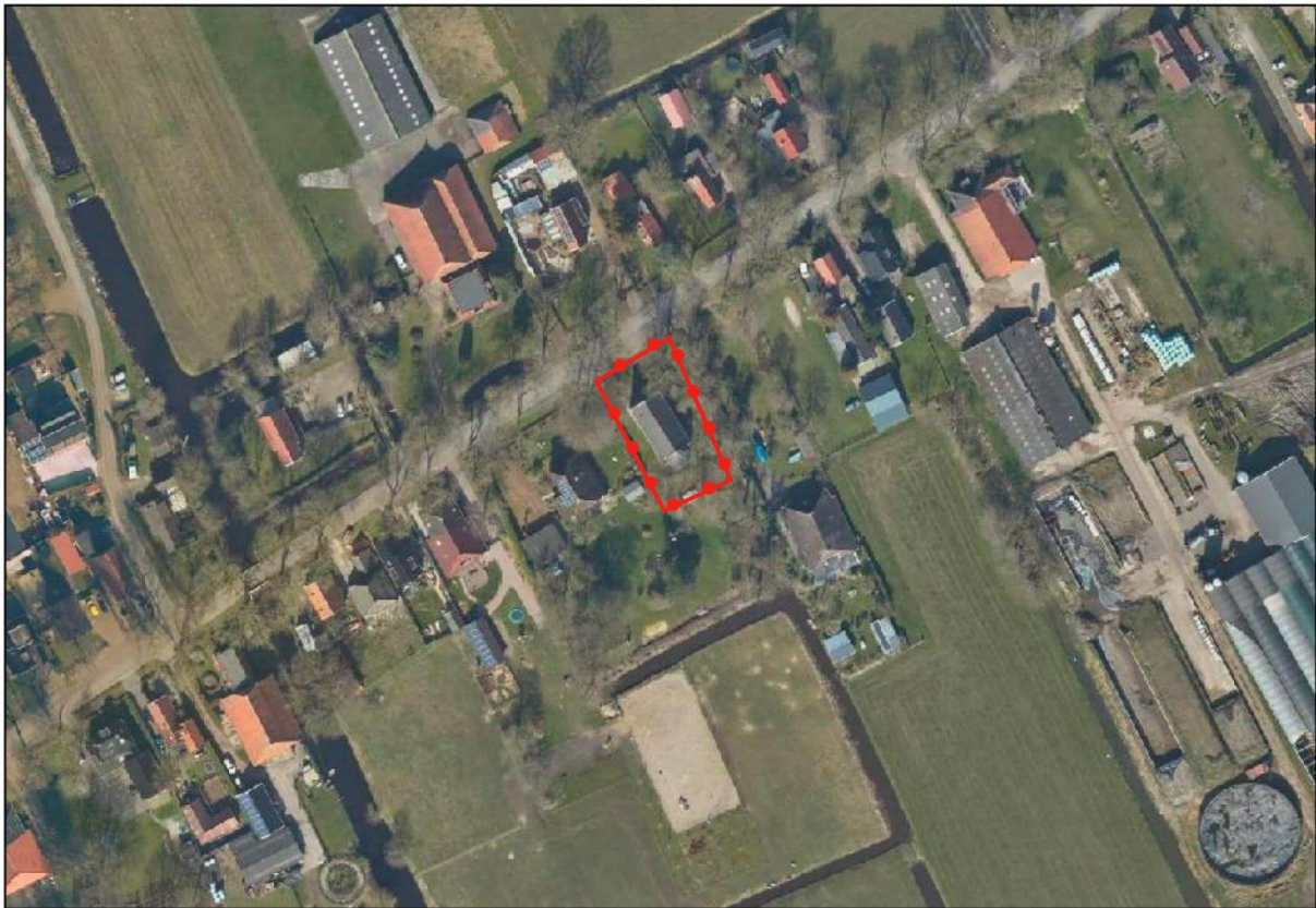
Afbeelding 2.1 Luchtfoto van het plangebied

Op onderstaande afbeelding is het plangebied indicatief aangeduid met een rode omlijning.