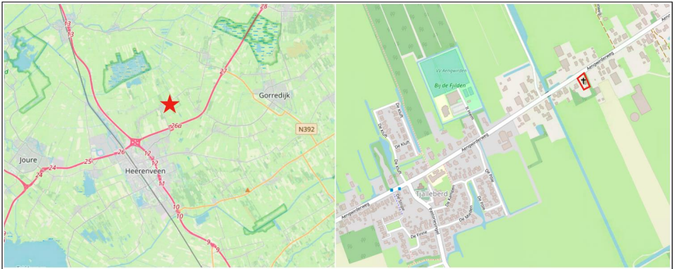
Afbeelding 1.1 Ligging van het plangebied ten opzichte van de (directe) omgeving

In afbeelding 1.1 is de ligging van het plangebied ten opzichte van Heerenveen en de directe omgeving indicatief weergegeven. Het plangebied is aangeduid met de rode ster en rode contour.