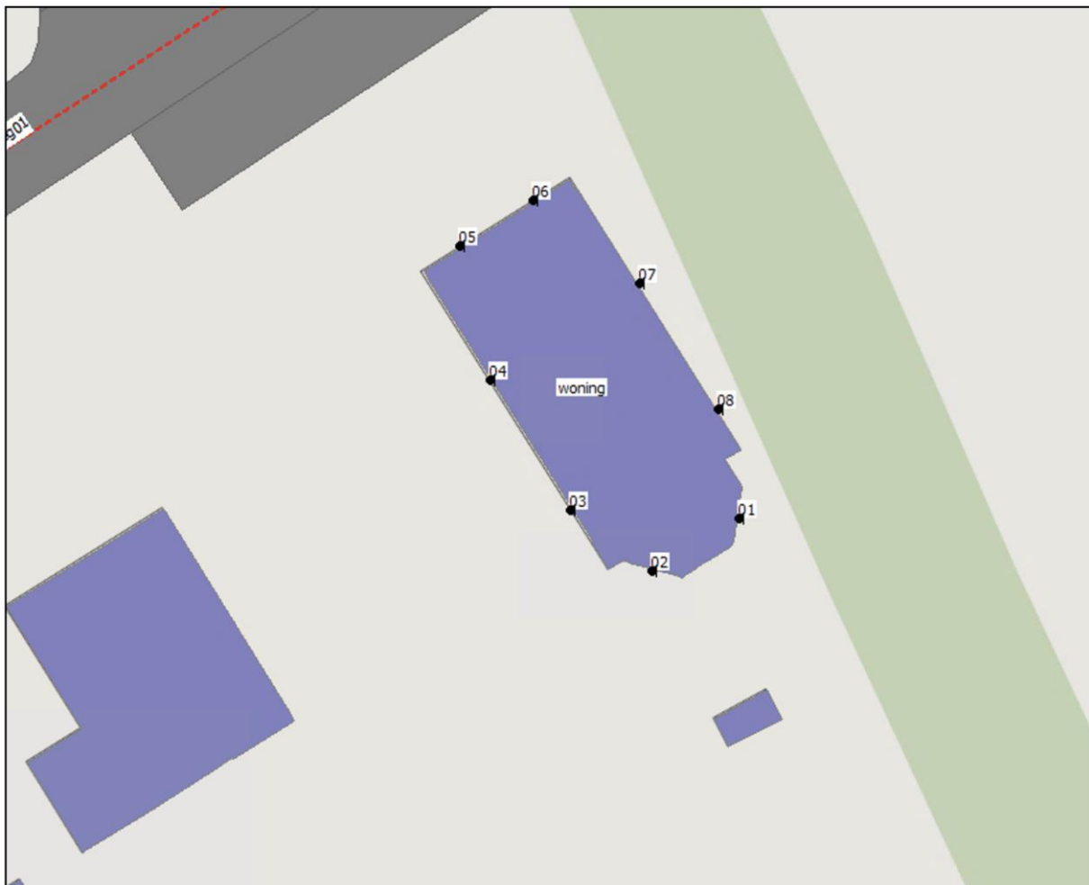
Afbeelding 4.1 Geplaatste toetspunten op de gevels

Om de geluidsbelasting op de gevels te berekenen zijn 8 toetspunten geplaatst waarbij er een toetspunt op 1,5 meter, 4,5 meter en 7,5 meter is geplaatst. In afbeelding 4.1 zijn de geplaatste toetspunten weergegeven.