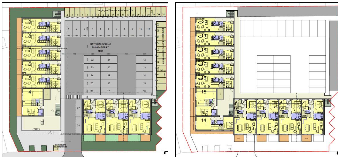
Figuur 3. Impressie van de plannen aan de Thorbeckestraat 3 te Heerenveen.