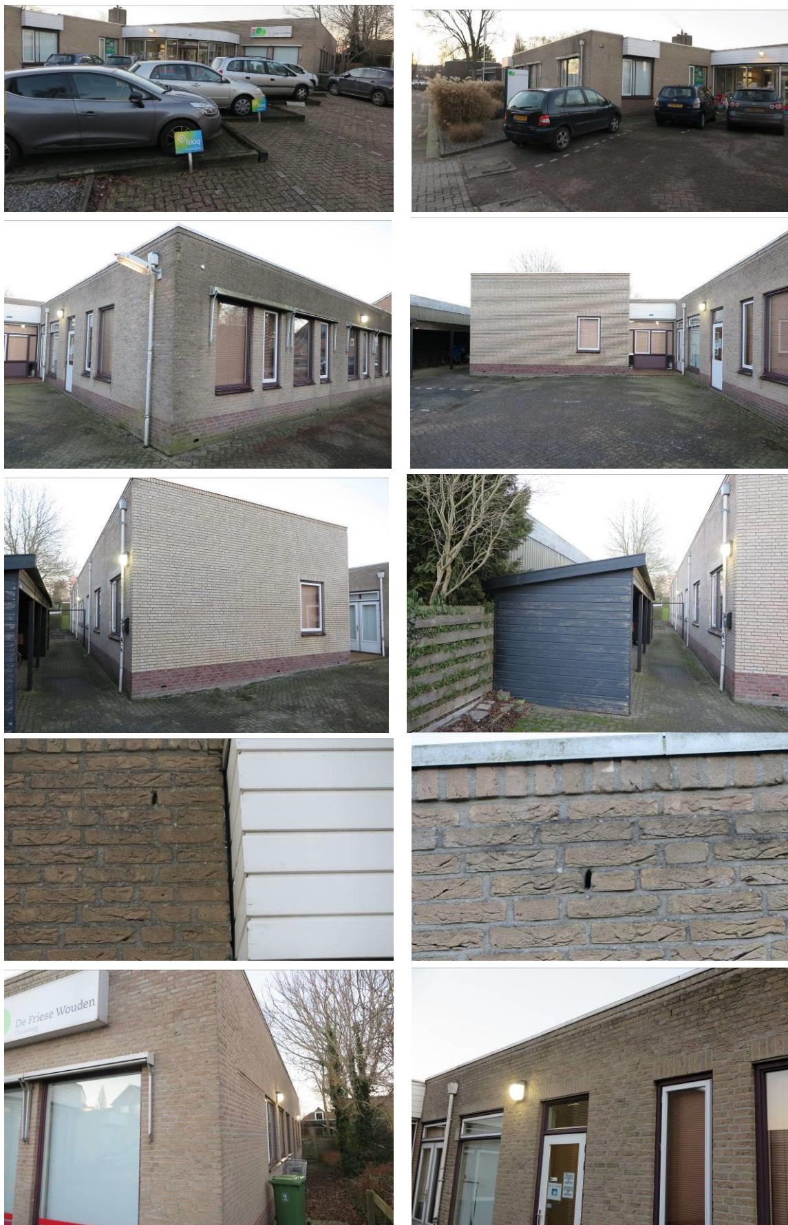
Figuur 2. Foto-impresie van het plangebied Thorbeckestraat 3 te Heerenveen.