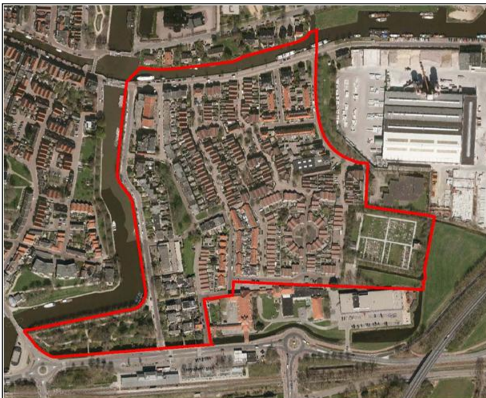
Figuur 1. De ligging van het beheersgebied

In het volgende figuur is de ligging van het beheersgebied weergegeven.