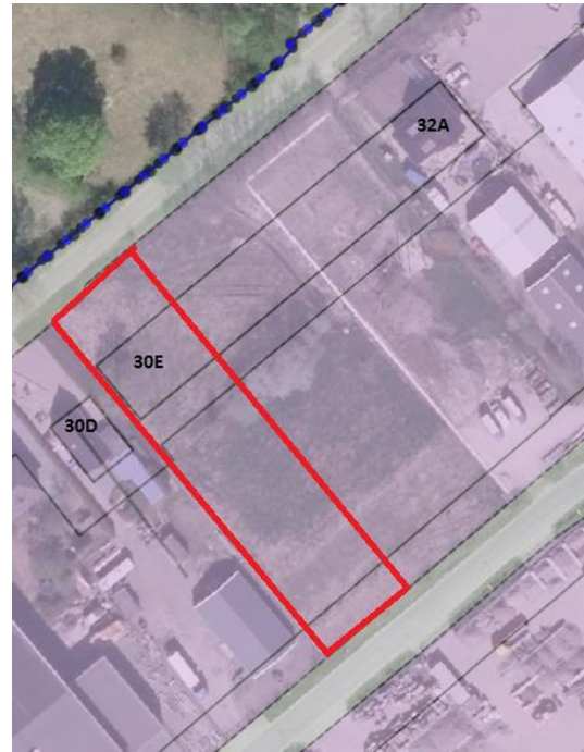
Uitsnede geldende bestemmingsplan Buitengebied met perceel Alde Dyk 30E (begrenzing is indicatief)

Het perceel Alde Dyk 30E te Kootstertille valt onder het bestemmingsplan Kootstertille 2 , vastgesteld op 16 mei 2013. Het heeft daarin de bestemming 'Bedrijventerrein' en bevat twee bouwvlakken; één voor een bedrijfswoning gericht op de Alde Dyk, en een groter bouwvlak erachter waar de bedrijfsbebouwing is toegestaan.