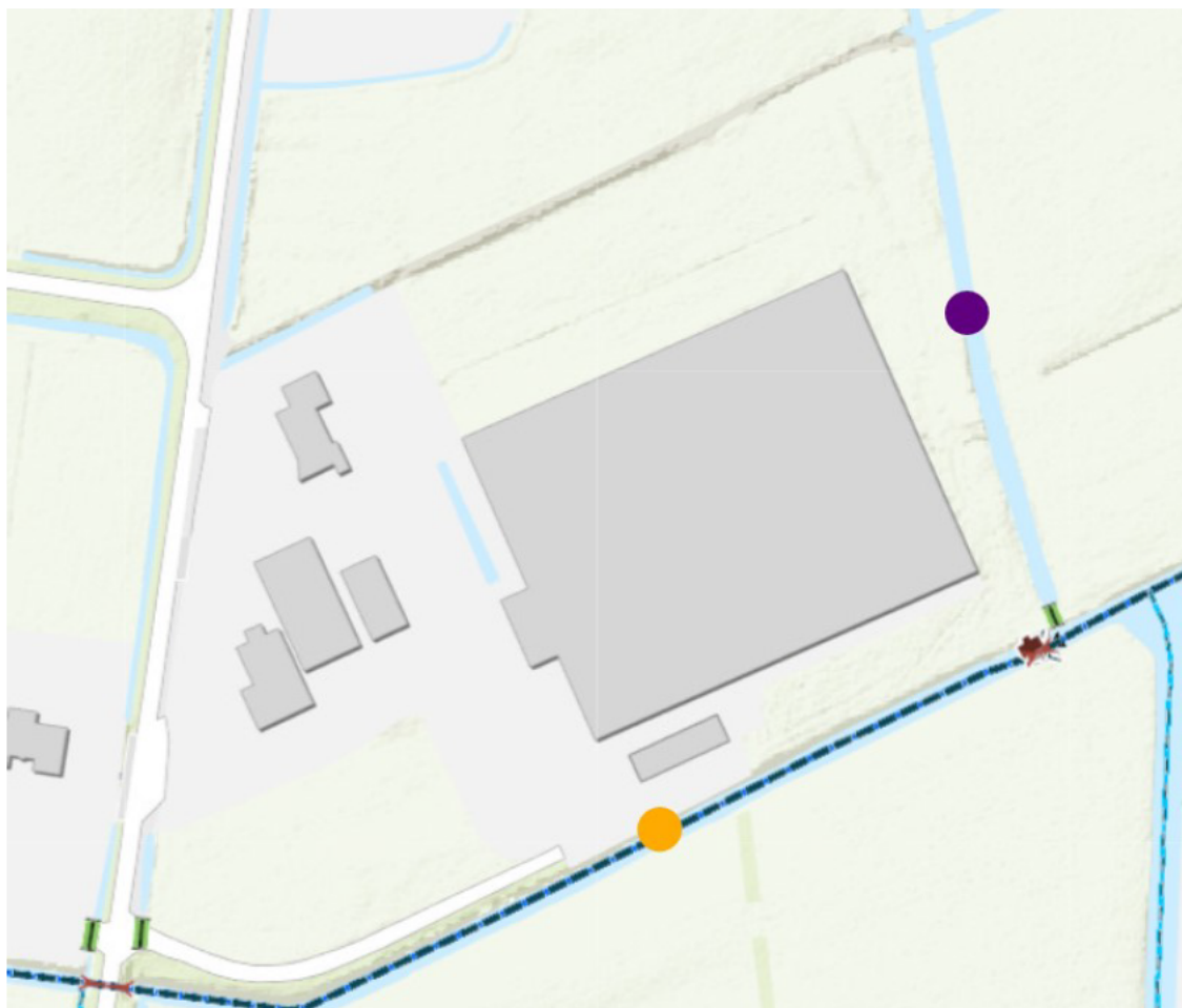
Figuur 1 Situatie waterlopen

Als we naar de kaart wateroverlast uit de Friese klimaatatlas kijken (figuur 2) zien we dat er in de huidige situatie al wateroverlast is in de watergangen rondom de projectlocatie, hier ruimte maken ter compensatie is dus een must.