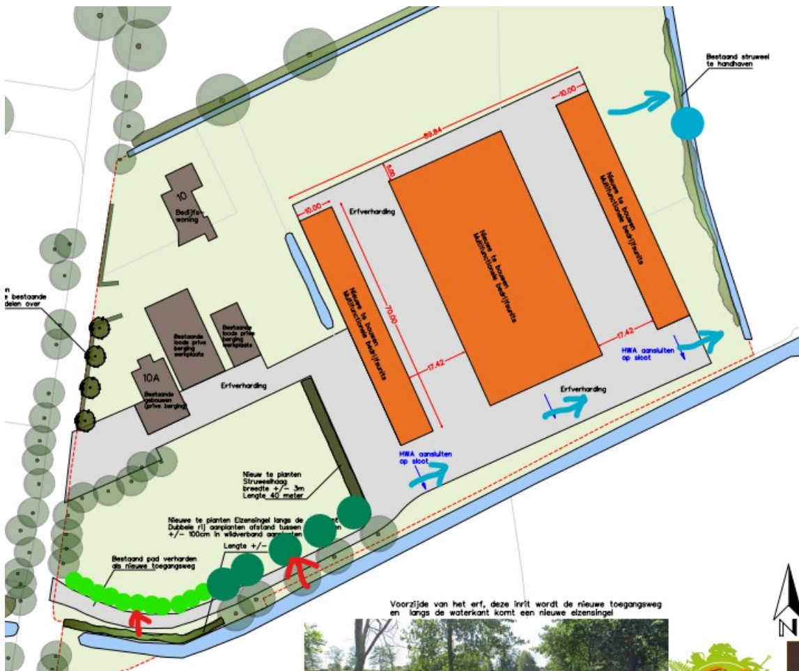
Figuur 3 Uitsnede Inrichtingsplan