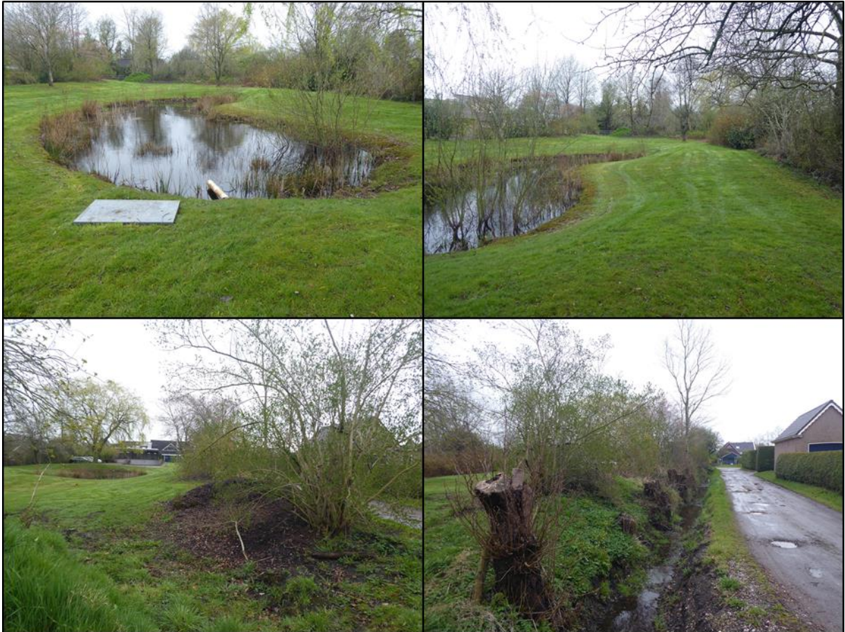
Figuur 1. Impressie plangebied te Harkema.

Het plangebied bevindt zich noordelijk binnen de bebouwde kom van Harkema en bestaat uit een achtertuin van De Singel 35 met een vijver, grasland en omgeven door stroken van bomen en struiken (figuur 1/2). Ten zuiden en westen wordt het plangebied begrensd door smalle watergangen. Ten westen grenst het perceel aan de straat Fiifhuzen. De omgeving van het plangebied wordt gekenmerkt door de bebouwde kom van Harkema en agrarisch gebied.