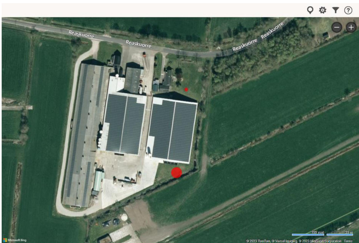
Figuur 2: Situering windmolen

De aanleiding tot onderhavig initiatief is in paragraaf 1.1 beschreven. Het initiatief bestaat uit de wens om een windturbine te realiseren als onderdeel van de verduurzaming van het pluimveebedrijf. De windturbine heeft een as-hoogte van 14.66 meter met een wielengte van 8 meter.