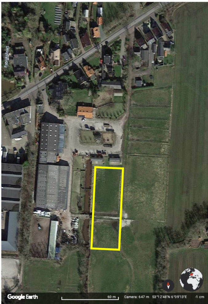
Figuur 1 Locatie voor plaatsing verblijfsaccomodatatie en ondersteunende faciliteiten (geel omlijnd).

De Wilgenhoeve bestaat uit een paardenstal en enkele verblijfsrecreatie-elementen. De verblijfsrecreatie wil men uitbreiden met aanvullende verblijfsaccomodaties, zoals trekkershutten en stacaravans. Deze komen aan de achterzijde op het terrein. De locatie is weergegeven in figuur 1.