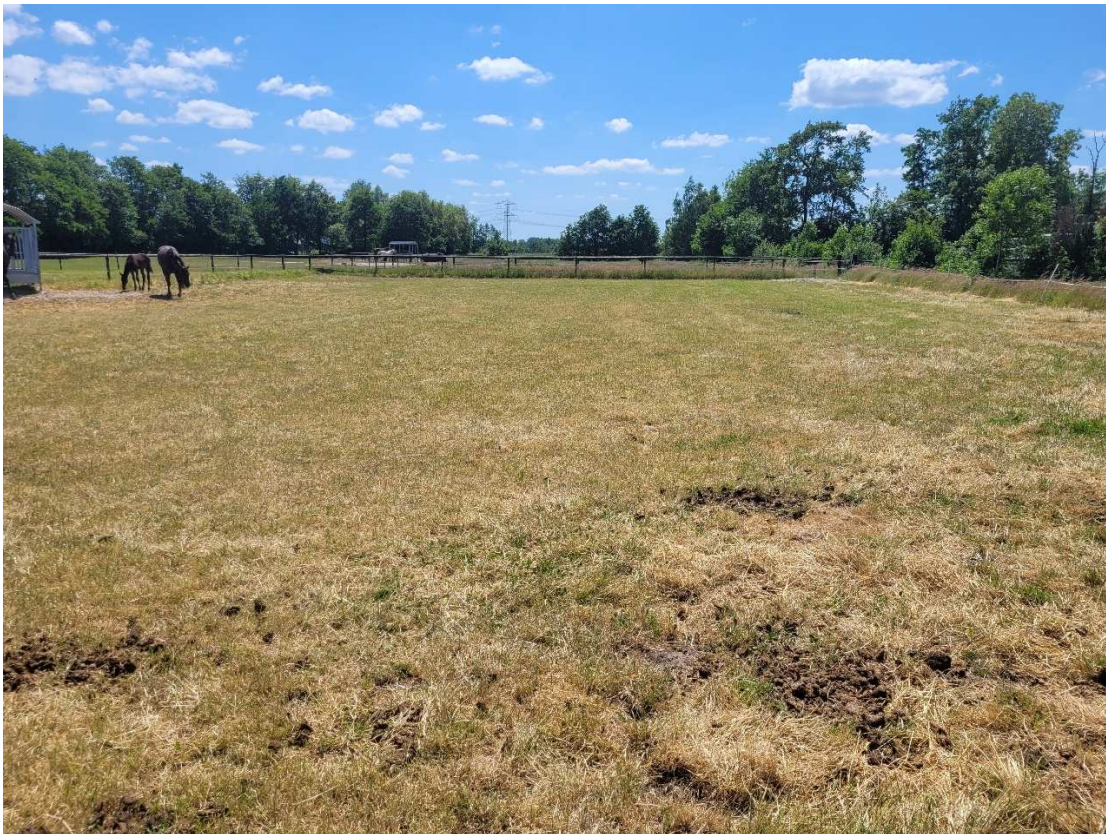
Foto 1 Locatie voor uitbreiding verblijfsaccomodatie De Wilgenhoeve: paardenwei.

Foto's 1 geeft een indruk van het terrein.