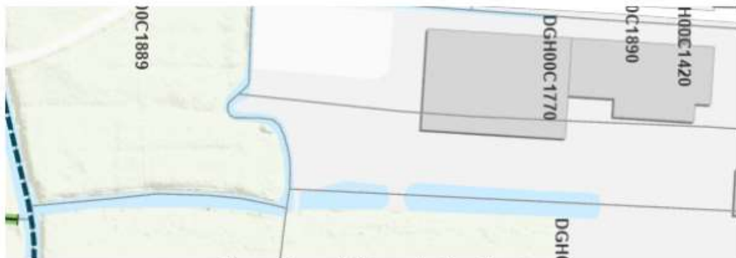
Figuur 2: aansluiting op het hoofdwater