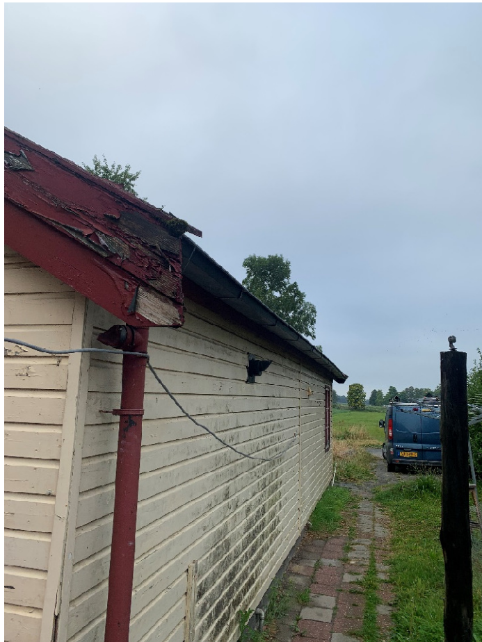
Oostzijde schuur dakgoot