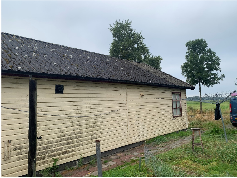
Oostzijde schuur met asbesthoudende dakplaten