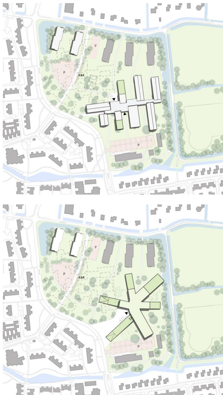
Figuur 2 De twee concepten voor de nieuwe situatie. Afbeeldingen uit: "Haalbaarheidsonderzoek Winsum 0-110".

In het plangebied is op dit moment onder meer het verpleeghuis De Twaalf Hoven aanwezig. Een oud deel van dit complex wordt gesloopt. In de nieuwe situatie wordt een kindcentrum gerealiseerd. Dit wordt mogelijk gecombineerd met een centraal voorzieningengebouw ten behoeve van verpleeghuis De Twaalf Hoven. Hiervoor zijn twee concepten, als weergegeven in figuur 2. Het nieuwe gebouw zal het gezamenlijke nieuwe onderkomen vormen voor een aantal basisscholen in de kern Winsum, ruimtes voor kinderopvang en andere kindvoorzieningen. In onderzoek is verder om in het gebouw een aantal zorgvoorzieningen onder te brengen, mede als vervanging van het huidige verpleeghuis De Twaalf Hoven. Ook is het voornemen om twee woon-zorg appartementen, te realiseren, in het verlengde van de drie appartementengebouwen die er al gerealiseerd zijn.