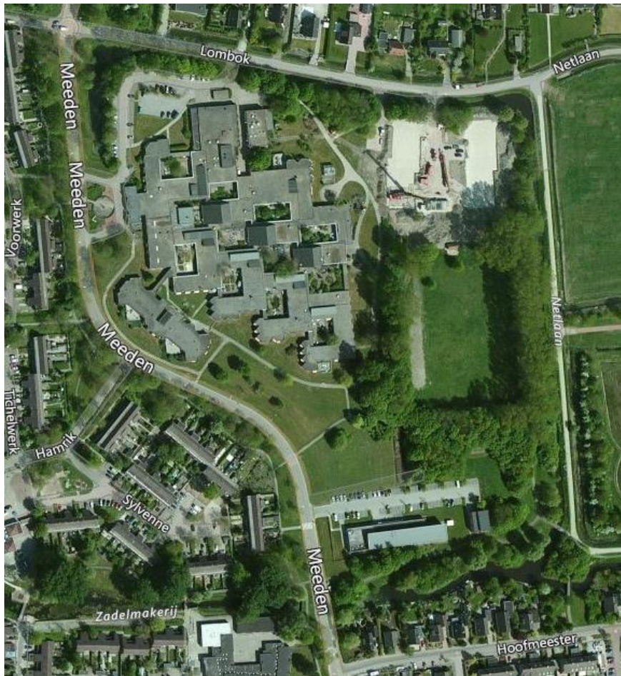
Figuur 1 De ligging van het plangebied. (bron: Bingmaps).

Het plangebied is gelegen aan de Meeden in Winsum (provincie Groningen) (fig. 1). Op dit terrein is De Twaalf Hoven gelegen (noordwesten). Dit bestaat deels uit nieuwbouw. Het oude, te slopen deel bestaat uit laagbouw met een plat dak. Aan de zuidzijde van het plangebied ligt een nieuw gebouwd gezondheidscentrum.