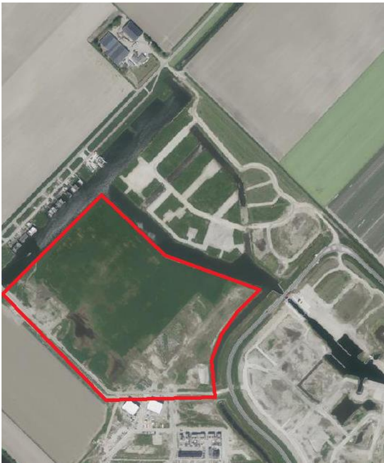
Figuur 1 Locatie plangebied

Aan de noordzijde van Zeewolde wordt de wijk Polderwijk gerealiseerd. In de Polderwijk is ruimte voor ongeveer 2.950 woningen. De woonwijk wordt gefaseerd gerealiseerd. Ten behoeve hiervan is het bestemmingsplan "Polderwijk" (2004) opgesteld waarin de woonwijk via een uitwerkingsregeling kan worden ontwikkeld. Inmiddels is het eerste deel, het Parkkwartier, nagenoeg ontwikkeld. De woonwijk wordt in delen (Bergkwartier, Waterkwartier en Havenkwartier/Eilandenrijk) gefaseerd gerealiseerd. Met dit uitwerkingsplan wordt de realisatie van maximaal 260 grondgebonden woningen en maximaal 40 appartementenwoningen mogelijk gemaakt in het wijkdeel Eilandenbuurt welke onderdeel uitmaakt van Waterkwartier. Deze ontwikkeling past binnen de uitwerkingsregels, zoals die in het bestemmingsplan "Polderwijk-Noord" zijn opgenomen. Het uitwerkingsplan voorziet in een concrete planologische regeling voor de beoogde woningbouw. Ten behoeve van deze ruimtelijke procedure is eveneens een vormvrije m.e.r.-beoordeling noodzakelijk. De betreffende planlocatie is weergegeven in figuur 1.