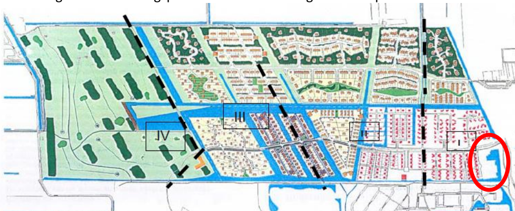
Afbeelding 2.2: Verkavelingsplan met waterscheidingen en compartimenten

(Waterhuishoudingsplan Buitenwoel fase 2, WiBo, def. 11-08-2003)