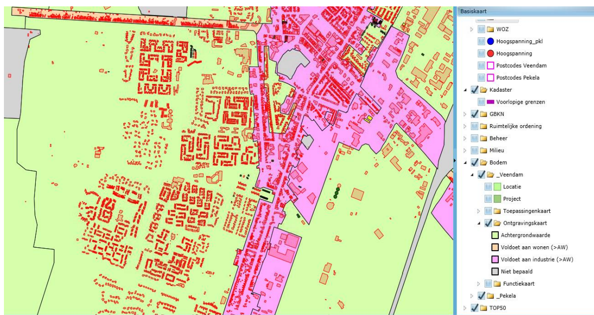
figuur: Ontgravingskaart Bodemkwaliteitskaart gemeente Veendam

Het bestemmingsplan Sorghvliet valt in meerdere deelgebieden van de bodemkwaliteitskaart.