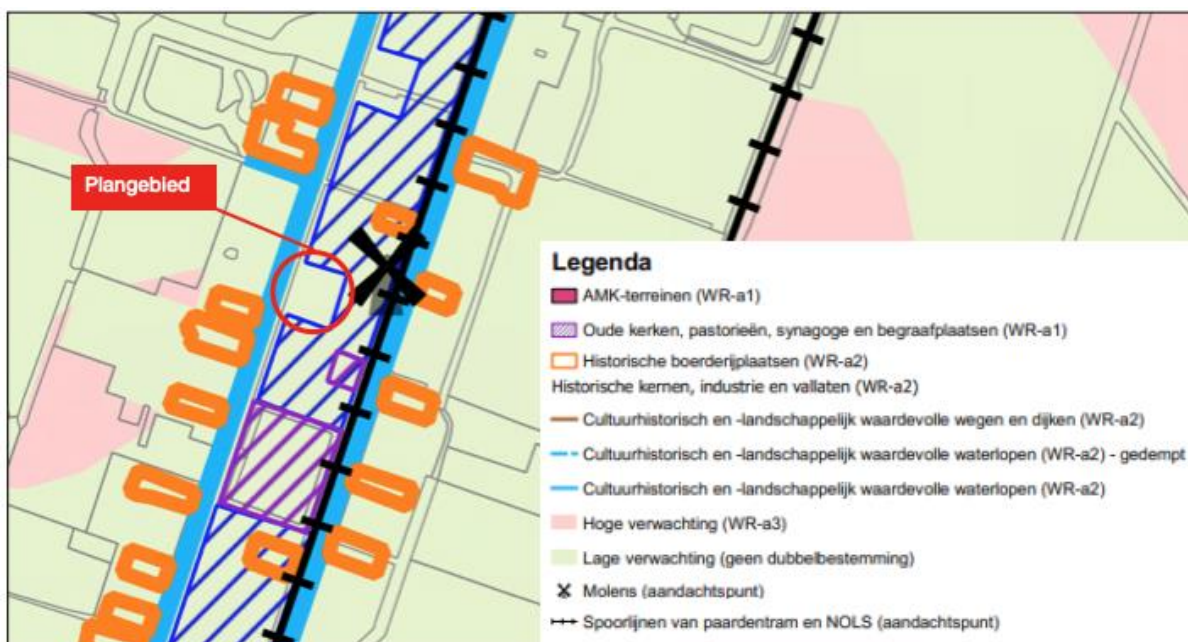
Afbeelding 5.1 Uitsnede 'Beleidskaart archeologie en cultuurhistorie Veendam 2022'