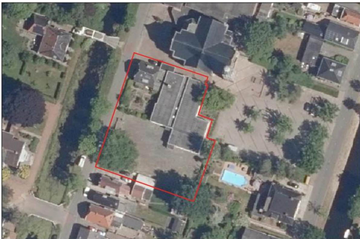
Afbeelding 2.1 Luchtfoto ligging plangebied

In afbeelding 2.1 en afbeelding 2.2 is met een luchtfoto en straatbeelden de bestaande situatie in het plangebied weergegeven. Het plangebied is op de luchtfoto aangeduid met de rode omlijning. Op de onderste stratenbeeldfoto is de boom en het 'pleinmuurtje' aan de voorzijde te zien.