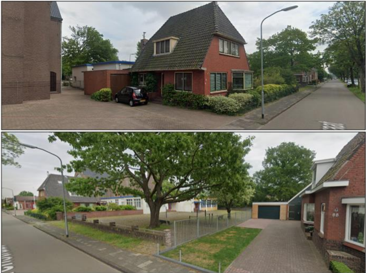
Afbeelding 2.2 Straatbeeld ter plaatse van de Torenstraat 84 (bovenste) en Torenstraat 86 (onderste)