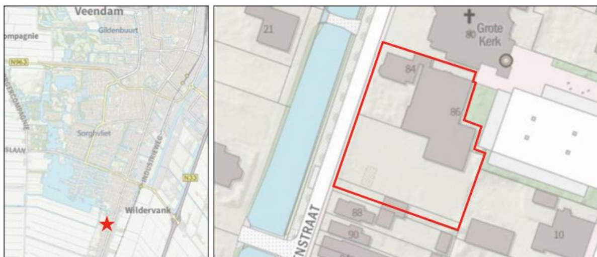
Afbeelding 1.1 Ligging van het plangebied ten opzichte van Veendam en de directe omgeving

Het plangebied ligt in het zuiden van de kern Veendam. De locatie staat kadastraal bekend als gemeentecode WDV02, sectie L, nummers 205, 233, 482, 503 en 504. In afbeelding 1.1 is de ligging van het plangebied ten opzichte van Wildervank en Veendam en ten opzichte van de directe omgeving weergegeven. De rode ster en de rode omlijning geven respectievelijk de locatie en indicatieve begrenzing van het plangebied weer. Voor een exacte weergave van de begrenzing van het plangebied wordt verwezen naar de verbeelding.