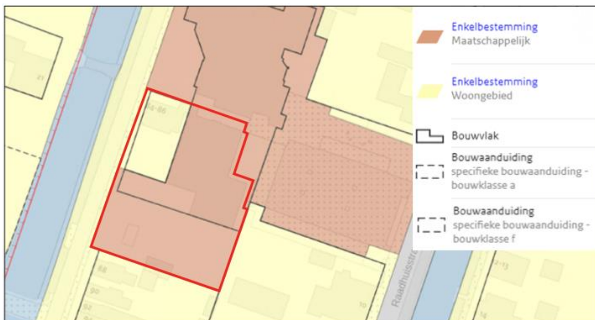
Afbeelding 1.2 Uitsnede verbeelding bestemmingsplan "Veendam Noord"

In afbeelding 1.2 is een uitsnede van de verbeelding behorende bij het bestemmingsplan "wildervank" opgenomen. Het plangebied wordt hierop aangeduid met de rode omlijning.