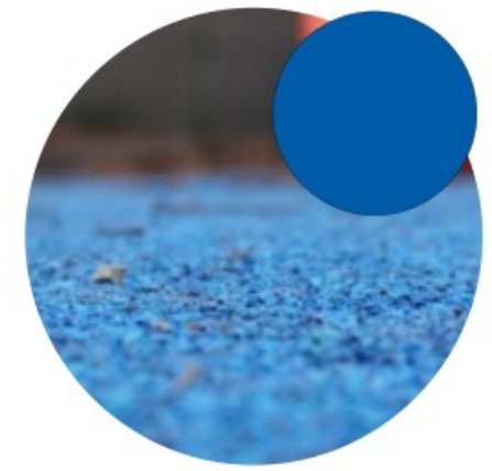
RUBBEREN GIETVLOER azuurblauw