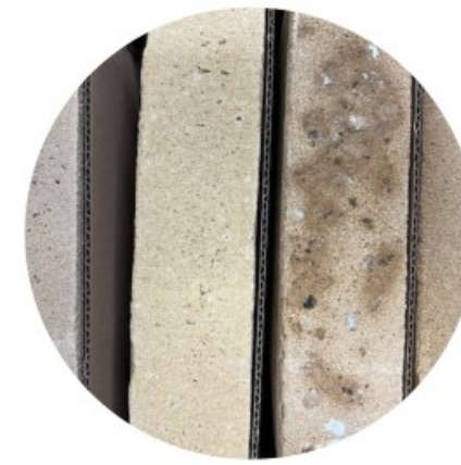
METSELWERK ZANDKLEUR ABERSON 30N258