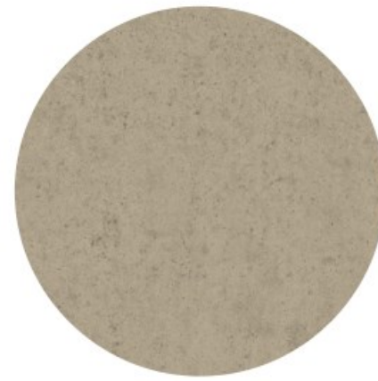
TERRAS Beton (zand kleur, passend bij metselwerk)