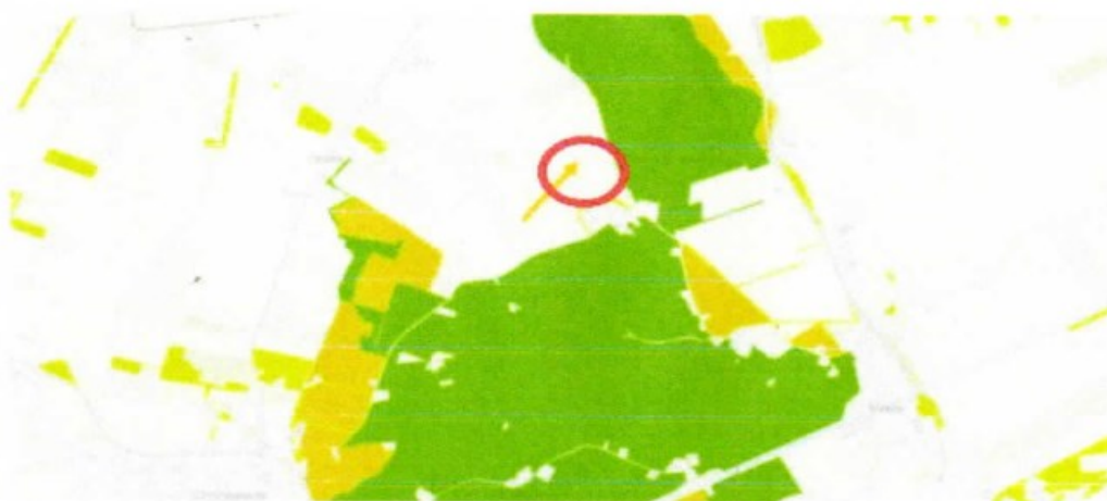
NNN-gebied rondom Wessinghuizen. Donkergroen is NNN-natuurgebied, okergeel is NNN-beheergebied en in limegroen zijn de bos- en natuurgebieden buiten de NNN aangegeven. De oranje pijl geeft de mogelijke verbinding aan die het Wessingboerbos kan realiseren.

De rode cirkel geeft de globale ligging van het perceel weer.