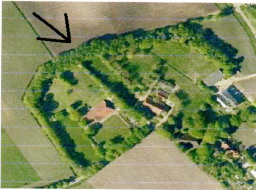
Eeuwen oud landschaps- element aangegeven met zwarte pijl.

Graag zou ik zien dat hier een archeoloog en een cultuur historicus over buigen en een oordeel zouden geven of dit uit historisch en maatschappelijk oog punt wel wenselijk is. Ook ben ik van mening dat de gemeente nog goed naar dit punt moet kijken en eventueel het Wessingboerbos moet schrappen / aanpassen zo dat dit kenmerk vanuit de lucht en de Wessinghuizerweg goed zichtbaar blijft.