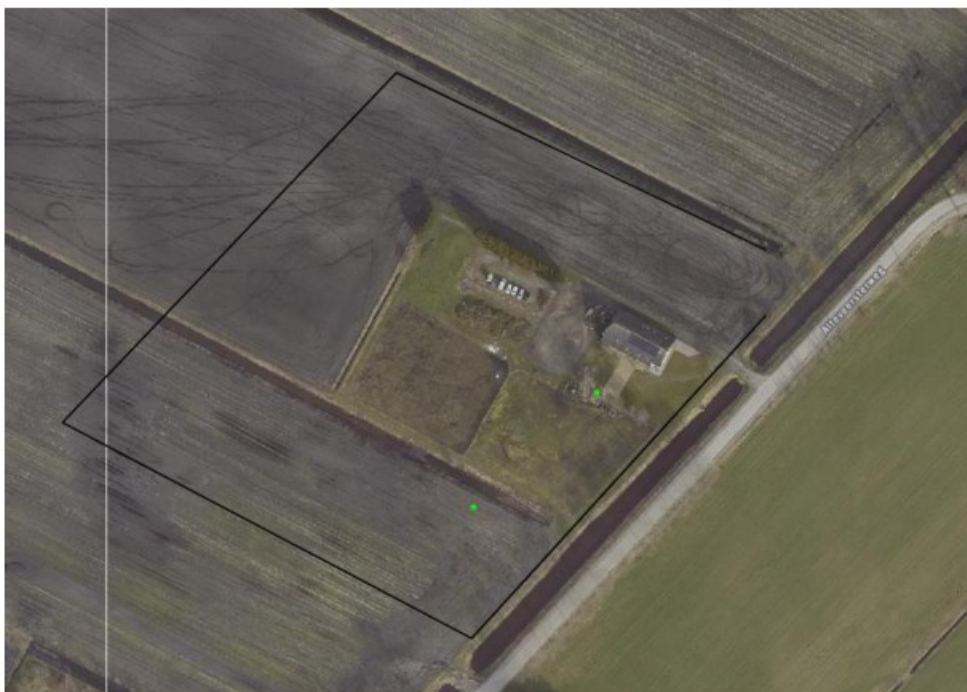
Verspreiding van alle bekende waarnemingen (groene stip) in de NDFF van planten en dieren in het plangebied.

Op 9 maart 2023 is de NDFF geraadpleegd en is gekeken of waarnemingen van beschermde planten en dieren aanwezig zijn in de databank. In een ruime begrenzing van het zoekgebied zijn 3 verschillende waarnemingen bekend in de NDFF. Voor de verspreiding van de waarnemingen, zie luchtfoto onder.