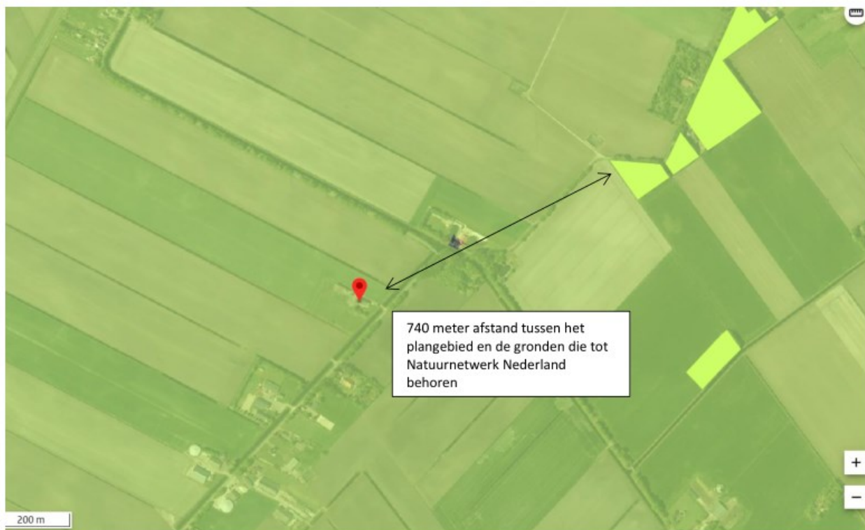
Ligging van Natuurnetwerk Nederland in de omgeving van het plangebied. De ligging van het plangebied wordt met de rode marker aangeduid. Gronden die tot Natuurnetwerk Nederland behoren worden met de felgroene kleur op de kaart aangeduid.