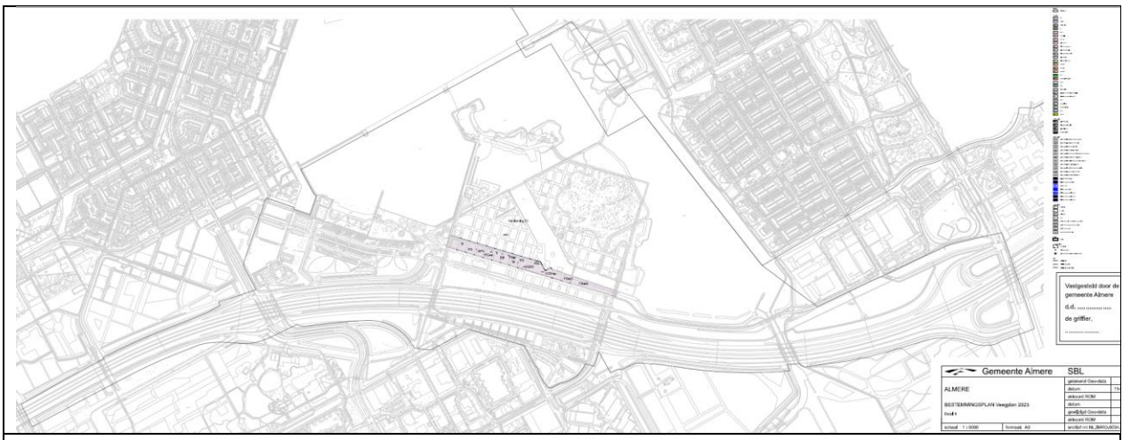
Afb 2: Roze vlak: gecorrigeerde contour voor de aanduiding FS-b6 in de verbeelding van het gewijzigd Veeplan 2023