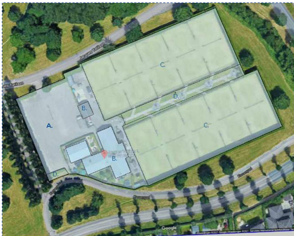
Figuur 1 - verhardingsoppervlaktes huidige situatie