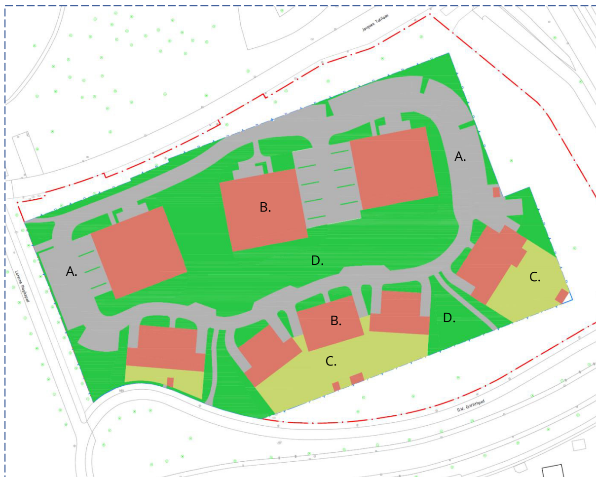
Figuur 2 - verhardingsoppervlaktes nieuwe situatie