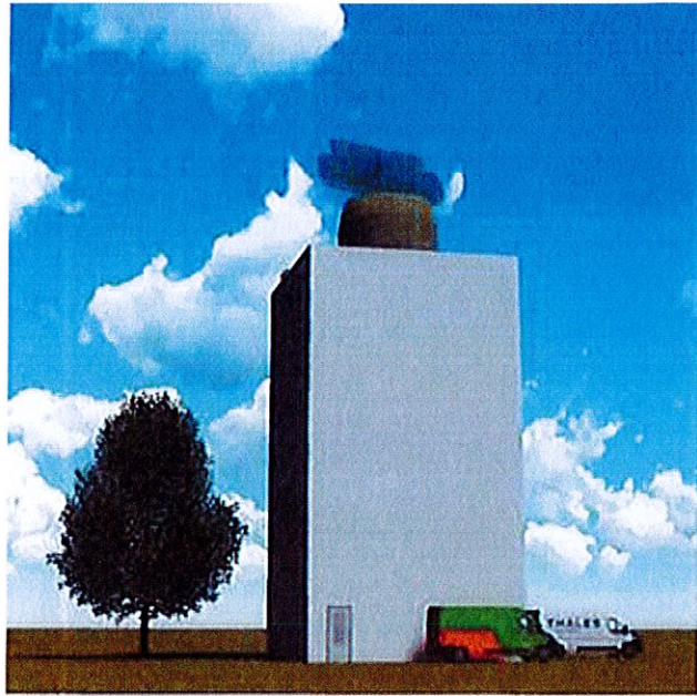
Impressie toekomstige situatie