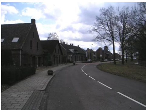
Zichtlijn op de Wilhelmus-Hubertusmolen