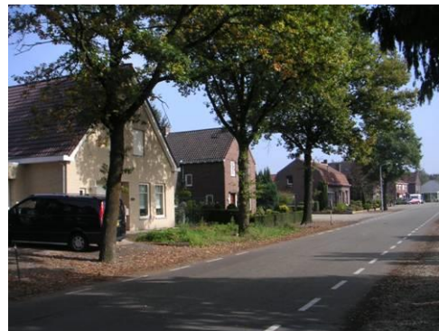
Nieuwbouw aan Hushoverweg 118c in afwijkende kleur