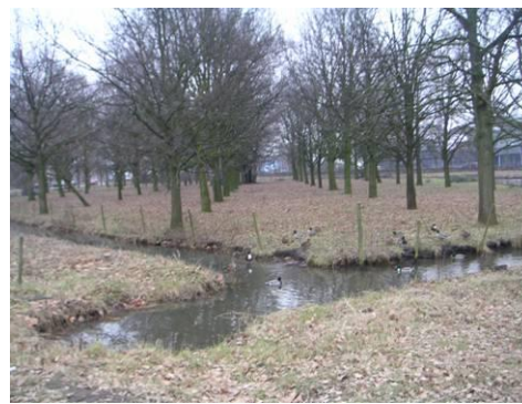
Groene karakter weide ten zuiden van Ringbaan