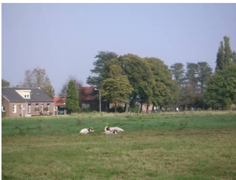
Open binnengebied aan Maasenweg met in het oog springende dakkapel op nummer 27