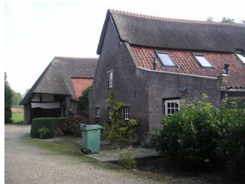
Gemeentelijk monument Maasenweg 6