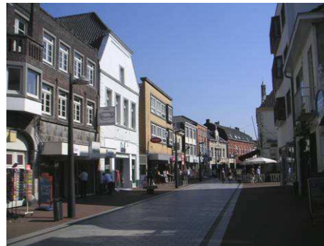
Oostzijde Langstraat tegenover Van Berlostraat