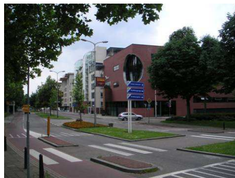
Nieuwbouw aan Kasteelsingel