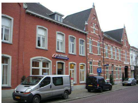
Zuidzijde Maaspoort, hotel Verstraeten