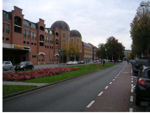
Ursulinencomplex aan de Wilhelminasingel