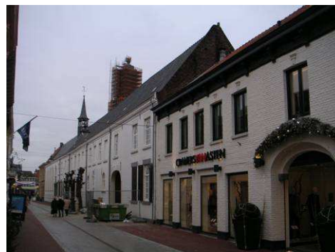
Noordzijde Maasstraat ter hoogte van klooster