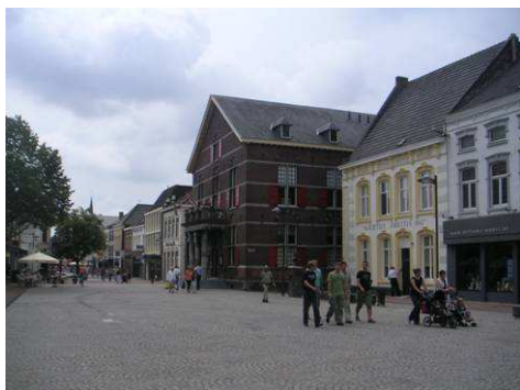
Markt met het Jacob van Hornemuseum