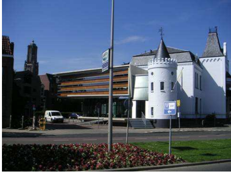
'Kasteel' Walburg met nieuwe vleugel