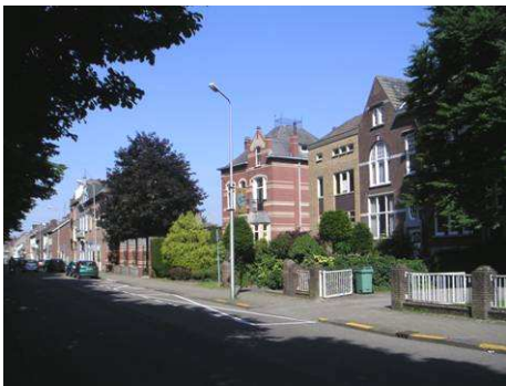
Westzijde Biest tegenover kasteel