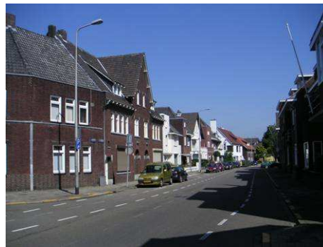
St. Paulusstraat vanaf Waag