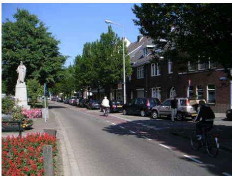
Oostzijde Emmasingel bij St. Paulusstraat