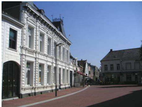
Oostzijde Oelemarkt richting Schoolstraat