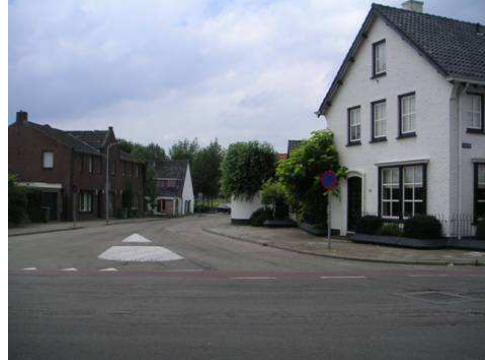
Beekpoort met aanzet richting Hushoverweg