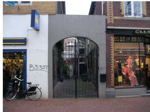
Steeg tussen Langstraat 4 en 6 (vakwerkgevel) Steeg tussen Langstraat 4 en 6 (vakwerkgevel)