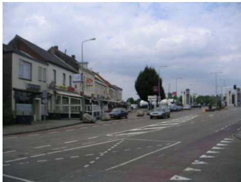
Bassin richting Stadsbrug