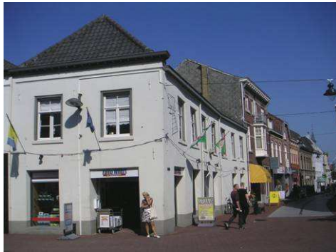
Hoek Markt – Maasstraat