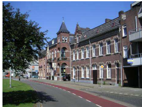
Oostzijde Emmasingel hoek Maaspoort