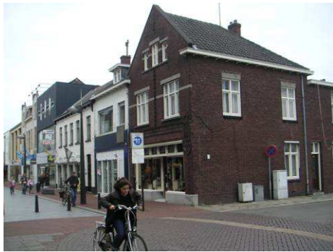
Stationsstraat hoek Boermansstraat