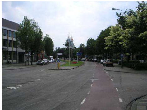
Profiel Wilhelminasingel bij vm. dubbele gracht