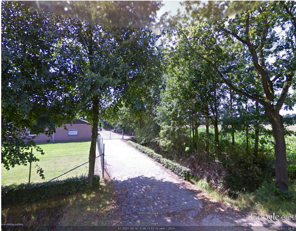
Afbeelding 2: Dierenwei (links) en houtsingel ten noorden van plangebied (rechts)

Aan de voorzijde van deze loods is een dierenwei en extra bomenrij (linden) aanwezig. Deze bomenrij met heg zal ook voor de nieuwe te bouwen woning worden doorgetrokken. Voor de woning zal een tuin worden aangelegd met een gazon en beplanting. De aanwezige beplanting ter plaatse zal zo veel mogelijk worden behouden.