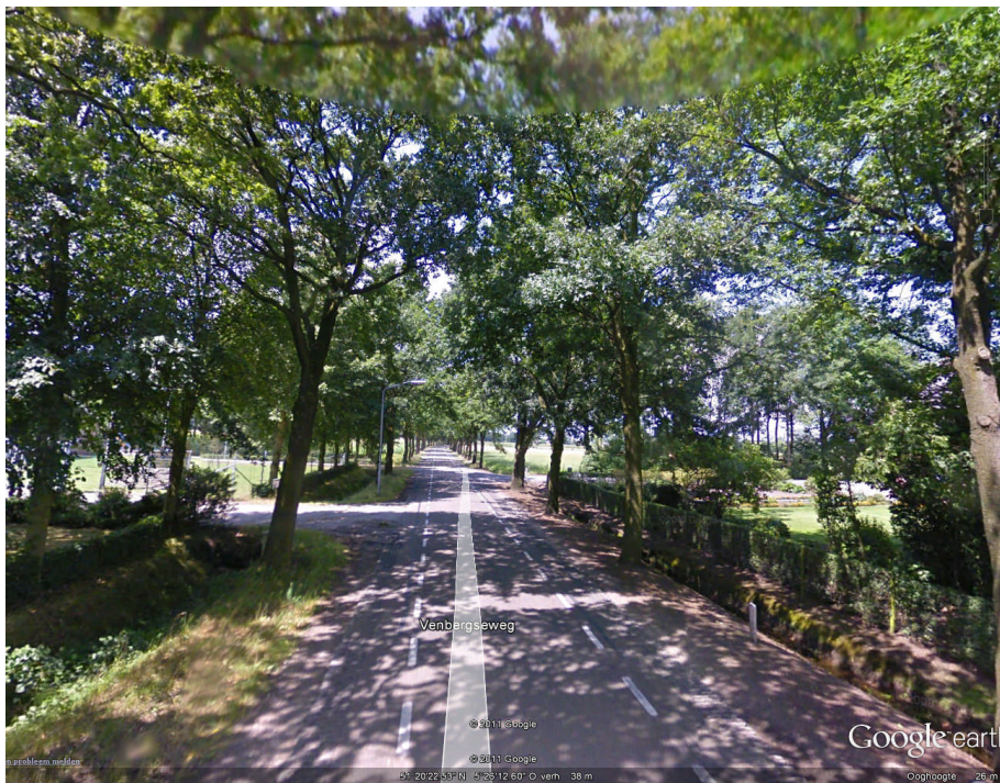
Afbeelding 1: wegbeplanting ter plaatse van Venbergseweg 34

Het plangebied is gelegen aan de Venbergseweg. Aan weerszijde van deze weg zijn eikenbomen aanwezig. Deze wegbeplanting is kenmerkend voor jonge zandontginningen in de Kempen. Deze structuur blijft behouden, de gewenste ontwikkeling heeft geen negatief effect hierop.