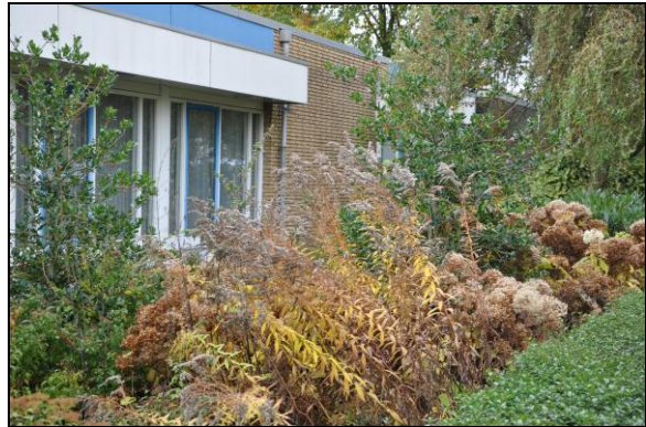
Figuur 3. Foto-impressie van Prinses Margrietstraat 2-6 te Woudenberg.