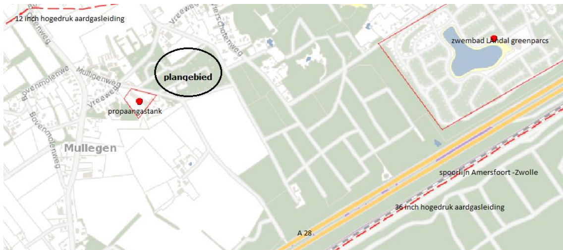
Risicobronnen nabijheid plangebied